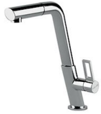
Mitigeur KE 8492 000