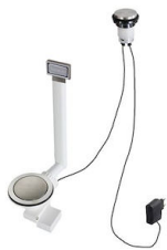
Vidange automatique Space Light - PL 8407 117