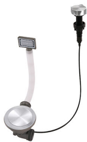
Vidange automatique Space Milano 8407 115