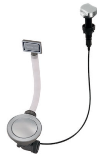
Vidange automatique Space - PE 8407 109